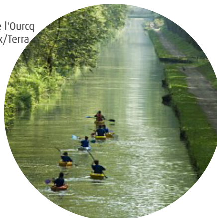
Canal de l'Ourcq

● Le dossier devra indiquer les incidences directes ou indirectes, temporaires ou permanentes du projet sur la ressource en eau, ainsi que les mesures correctrices ou compensatoires. Le por-