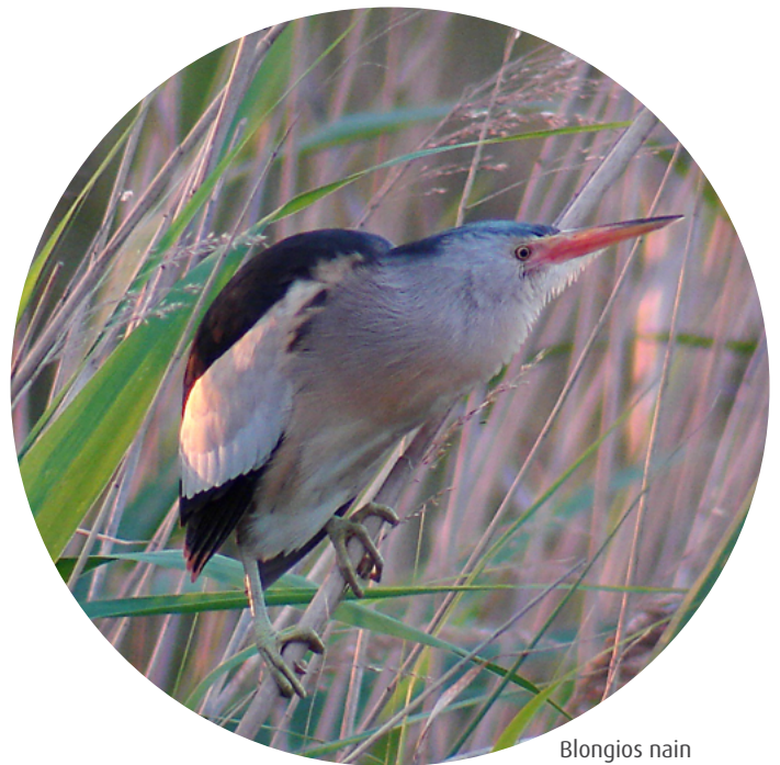
Blongios nain

Les OUGC permettent d'associer les irrigants sur un périmètre déterminé adapté, qui confie à un organisme unique, personne morale de droit public ou de droit privé, la répartition des volumes d'eau d'irrigation. En Île-de-France, il y a cinq organismes uniques concernant la nappe de Beauce et la nappe du Champigny. Ils seront consultés pour les dossiers d'autorisation environnementale concernant des projets d'ouvrages de prélèvement sur leur territoire de compétence.