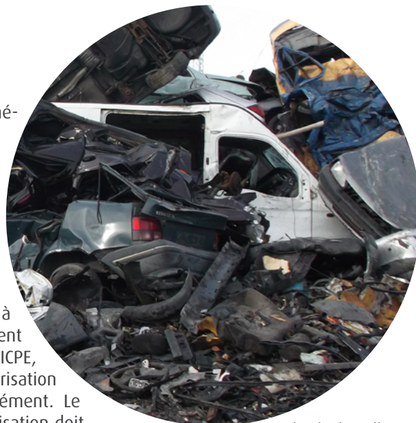
Véhicules hors d'usage

Dans le cas d'un site soumis à autorisation ou enregistrement au titre de la nomenclature ICPE, l'arrêté préfectoral d'autorisation environnementale vaut agrément. Le dossier de demande d'autorisation doit comporter les pièces complémentaires visées par les dispositions de l'article D.181-15-7.