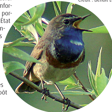
Gorge bleue à miroir

● réduire les délais d'instruction : le délai moyen visé pour statuer sur la demande d'autorisation est d'un an (hors délais de demandes de compléments) à compter du dépôt du dossier de demande.