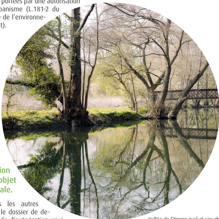
Vallée de l'Yerres aval et ses abords

- les autorisations de travaux en site classé ou en réserve naturelle nationale n'entrent pas dans le champ d'une autorisation environnementale si elles sont déjà portées par une autorisation d'urbanisme (L.181-2 du code de l'environnement).