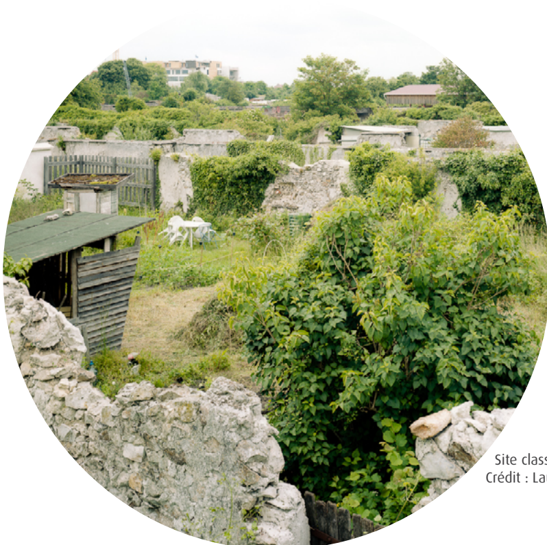
Site classé des murs à pêches de Montreuil

nature, des paysages et des sites et un avis conforme du ministre, lequel peut également consulter, s'il le juge utile, la Commission supérieure des sites, perspectives et paysages (CSSPP). Il est donc indispensable que les services de l'État soient informés du projet bien en amont du dépôt du dossier, notamment au moment d'échanges préalables, afin d'éviter des délais supplémentaires lors de l'instruction.