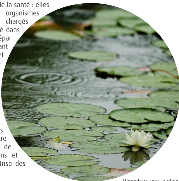
Nénuphars sous la pluie

Les agences régionales de santé unifient le service public de la santé : elles regroupent tous les organismes publics actuellement chargés des politiques de santé dans les régions et les départements. Coordonnant les forces de l'État et de l'Assurance maladie, elles constituent l'interlocuteur unique des professionnels de santé, des établissements de soins et médico-sociaux, des collectivités locales et des associations. Elles ont vocation à mettre en œuvre la politique de santé dans les régions et à contribuer à la maîtrise des