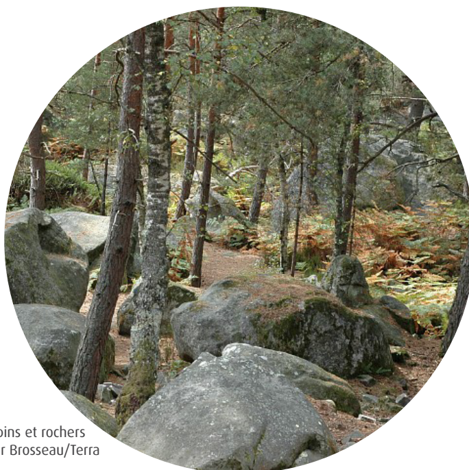
Forêt de Fontainebleau, pins et rochers