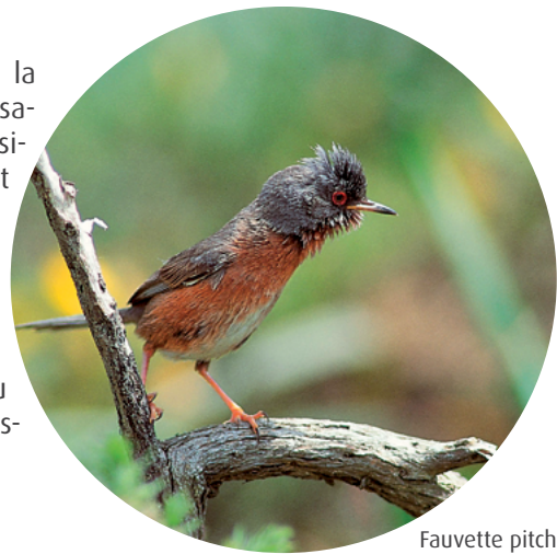
Fauvette pitchou

espèces protégées qui nécessitent la mise en place de mesures compensatoires. Par exemple, les impacts résiduels sont significatifs s'ils remettent en cause le bon fonctionnement du cycle biologique de ces espèces (migration, hibernation, reproduction, etc.). A noter qu'une dérogation « espèces protégées » est également nécessaire pour toute destruction ou tout déplacement de spécimen d'espèce protégée (capture/relâcher).