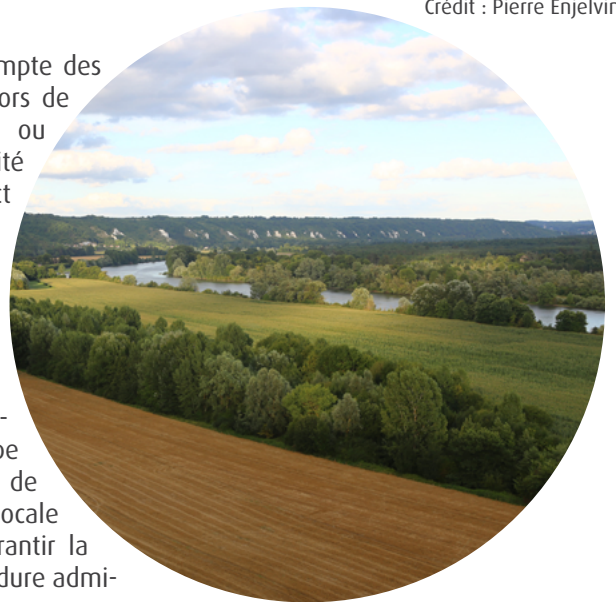
Site classé des falaises de la Roche Guyon et boucle de Moisson

La mise en place de l'autorisation environnementale s'inscrit dans ce processus de modernisation du droit de l'environnement.