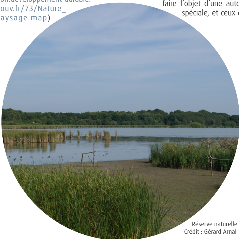
Réserve naturelle nationale de Saint-Quentin-en-Yvelines

● L'autorisation environnementale n'intègre pas les autorisations de travaux en RNN qui sont liées à une autorisation au titre du code de l'urbanisme (permis de construire, permis d'aménager, permis de démolir, déclaration préalable). La procédure d'autorisation « réserve naturelle nationale » est alors traitée dans le cadre de l'autorisation d'urbanisme.